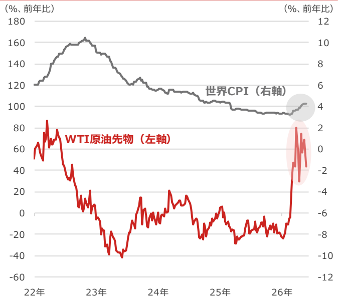
WTI（ウエスト・テキサス・インターミディエイト）原油先物と世界CPI（消費者物価指数）

期間：2022年1月7日～2026年5月29日、週次