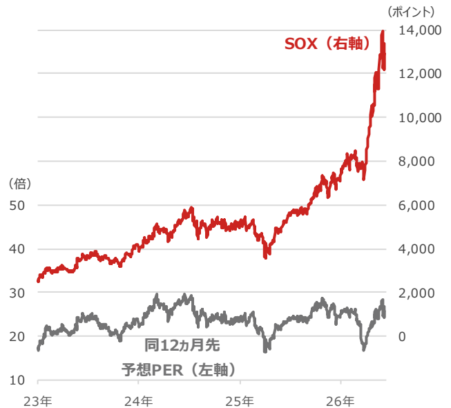
SOX（フィラデルフィア半導体株指数）と同12ヵ月先予想PER（株価収益率）

期間：2023年1月3日～2026年6月12日、日次 （出所）Bloombergより野村アセットマネジメント作成