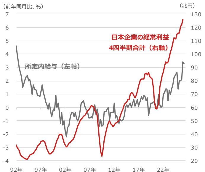
日本企業の経常利益4四半期合計と所定内給与

期間：（日本企業の経常利益）1992年1-3月期～2026年1-3月期、四半期 （所定内給与）1992年3月～2026年4月、四半期 ・日本企業の経常利益は法人企業統計のデータを用いた