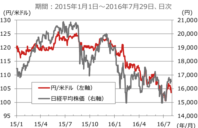
図1：円の対米ドル為替レートと日経平均株価

8月2日 政府経済対策閣議決定 8月3日 内閣改造、自民党役員人事 8月15日 4-6月期GDP（速報値）