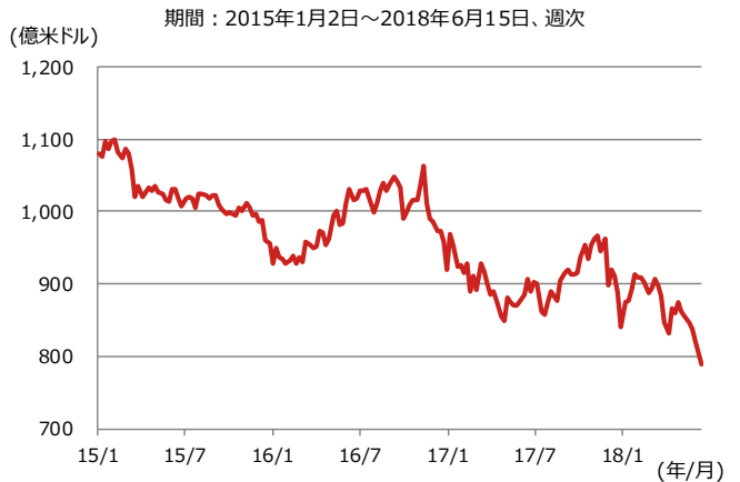
図3：トルコの外貨準備高