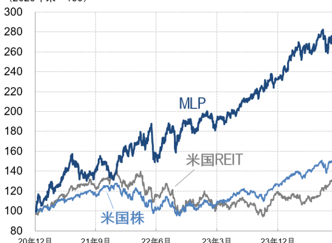
MLP・米国株・米国REITの配当利回りと長期金利