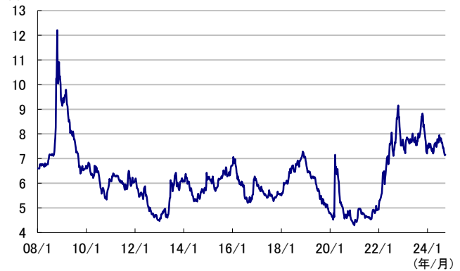
図3) JP Morgan EMBI Global インデックスのスプレッド*推移