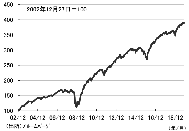
図2) 米国ハイ・イールド債指数と米国10年国債指数の利回り推移