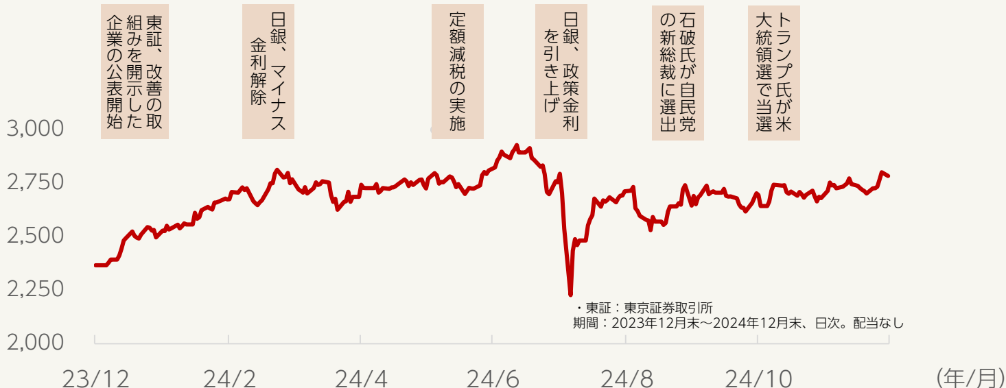
TOPIXの推移と主な出来事（過去1年間）

業種別では、金利上昇が好感された銀行業、証券、商品先物取引業のほか、主要企業による経営統合やROE（自己資本利益率）目標引き上げが好感された輸送用機器など23業種が上昇し、10業種がTOPIXの騰落率を上回りました。