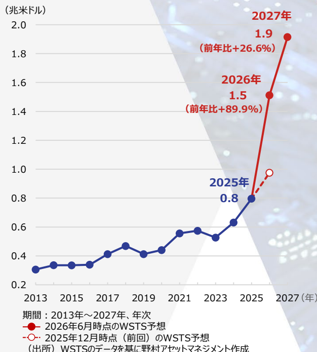
世界の半導体出荷額の推移