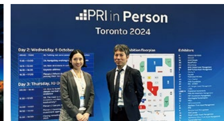
右：PRI in Person 2024への当社からの参加者