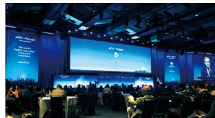
左：PRI in Person 2024での会場の様子

「投資家と企業の対話フォーラム」を企画しました。盛況だったことを受けてトロントでも同様のサイドイベントが開催されました。トロントでは、デンマークの海運企業やメキシコのセメント企業が登壇し、SBT取得のための移行計画の修正など、気候変動対策における実務の視点から様々な取組みが紹介されました。このサイドイベントはシリーズ化が決定しました。